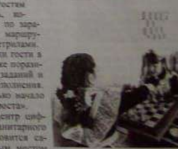
На открытии побывали наши корреспонденты Валентина ГУШИНА

То, что увидели гости в этот день, их уже поразило сложностью заданий и мастерством исполнения. А ведь это только начало работы «Точки роста». Ясно одно: центр цифрового и гуманитарного профилей становится самым популярным местом сбора талантливых учеников, тех, кто превалирует ценит новые знания и новый опыт.